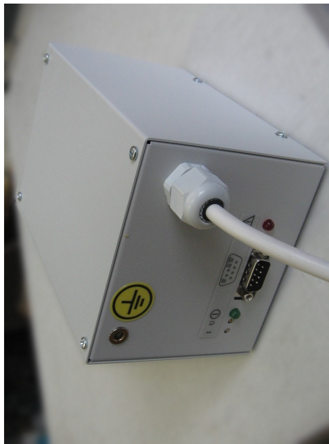
Рис. 3. Внешний вид ИВН-14-10 сзади