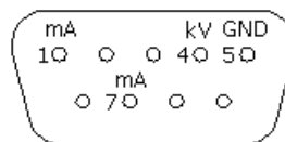
Рис.1. Цоколевка информационного разъема DB-9M

При подаче на источник питающей сети через 1,5-2сек на высоковольтном выводе появится высокое напряжение. Заводская настройка +11кВ. Контроль производится по уровню сигнала кV на выходе информационного разъема DB-9M, расположенного на задней панели источника. Цоколевка информационного разъема представлена на рис.1. Уровень напряжений на информационных выходах ограничен внутренними стабилитронами 5,1В.