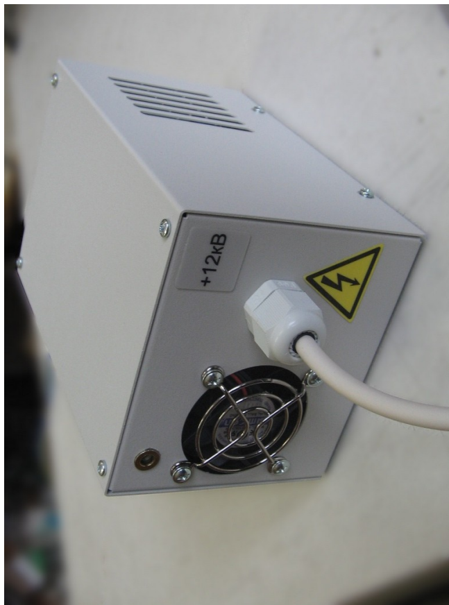
Рис. 2. Внешний вид ИВН-14-10 спереди