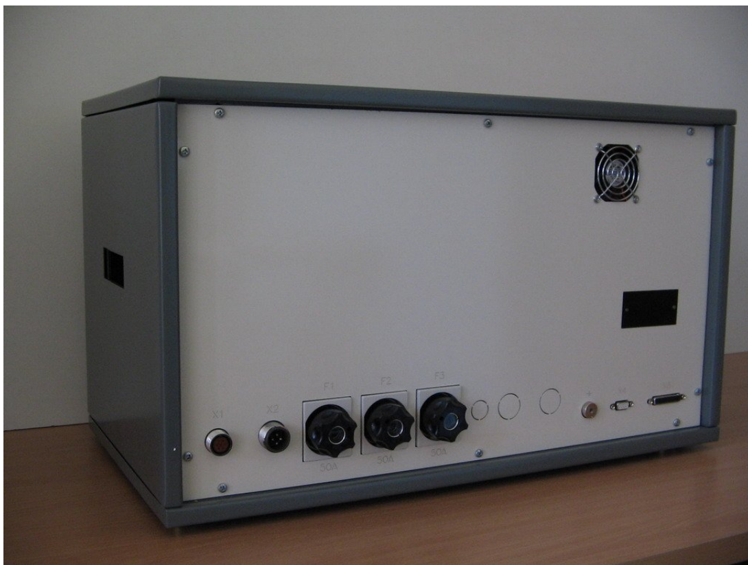
Рис. 3. Внешний вид УРПС-17 сзади.