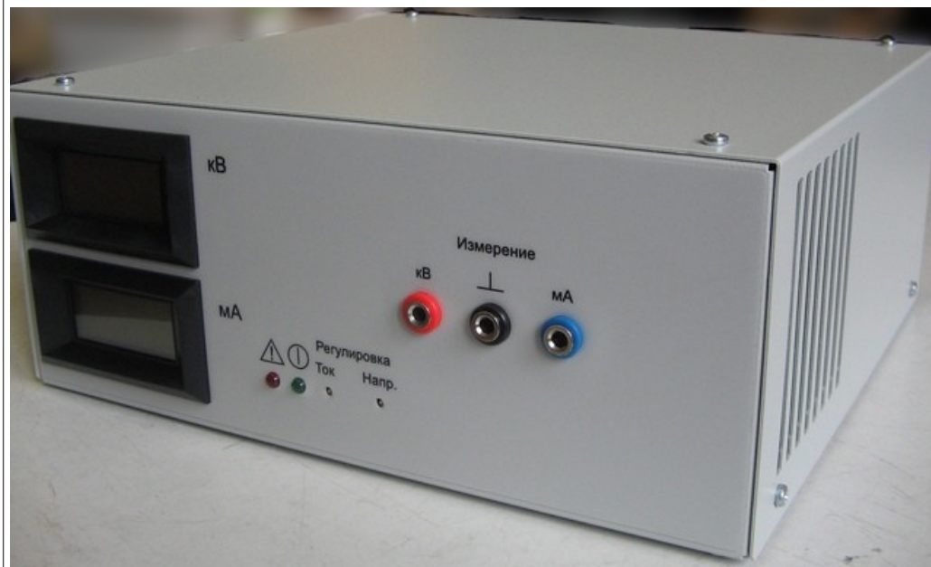
Рис.2. Внешний вид ИВН-10-15-20

Предприятие - изготовитель : ООО "Р - С И Б"