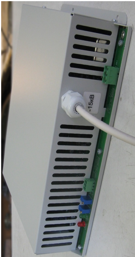
Рис. 2. Внешний вид ИВН-17-20 спереди