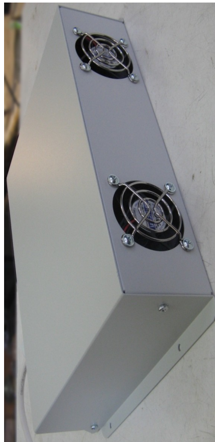
Рис. 3. Внешний вид ИВН-17-20 сзади

Предприятие - изготовитель : ООО "Р - С И Б"