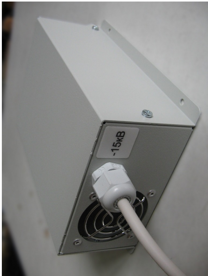
Рис. 3. Внешний вид ИВН-17-10 сзади

Предприятие - изготовитель : ООО "Р - С И Б"