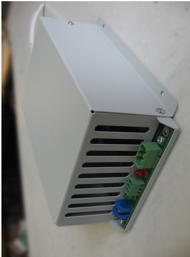
Рис. 2. Внешний вид ИВН-17-10 спереди